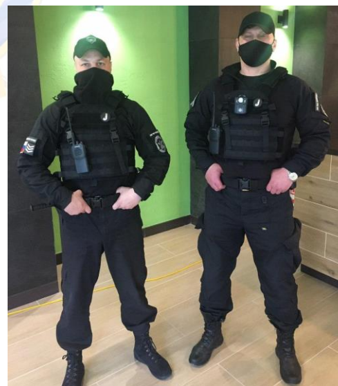
Охрана ЖК «Петровский на воде», СПб