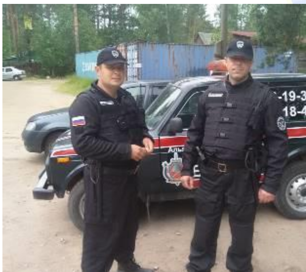
Охрана ДО «Орехово-Северное», ЛО