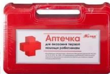
аптечка (на КПП)