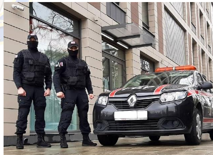
Группа быстрого реагирования