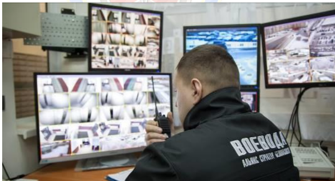
Пульт централизованного наблюдения